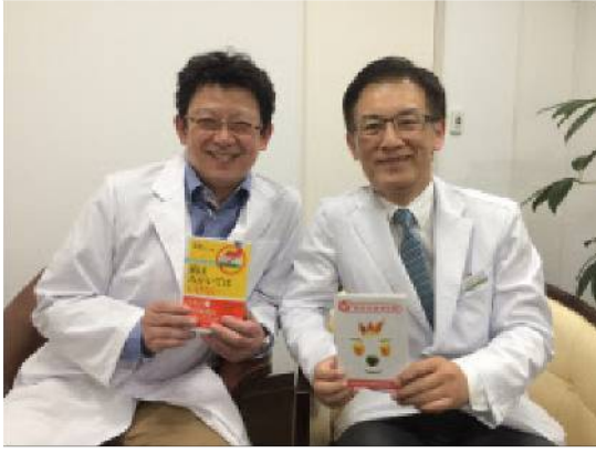
今後も書籍や講演などを通じて、医科と歯科の連携を訴えていく

を書けば、歯科医で抗生物質による歯周治療が直ちに開始できるようになりました。「糖尿病医による歯周病（英語名perio）処置」という意味で「P処（糖）」と呼ばれます。糖尿病の患者さんは、担当医に言ってみてください。